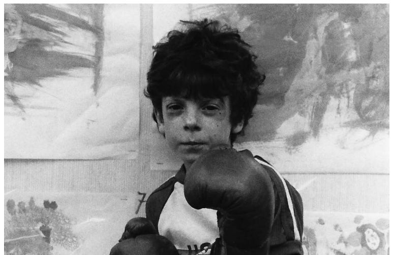
Extraits des archives de Camille de Toledo