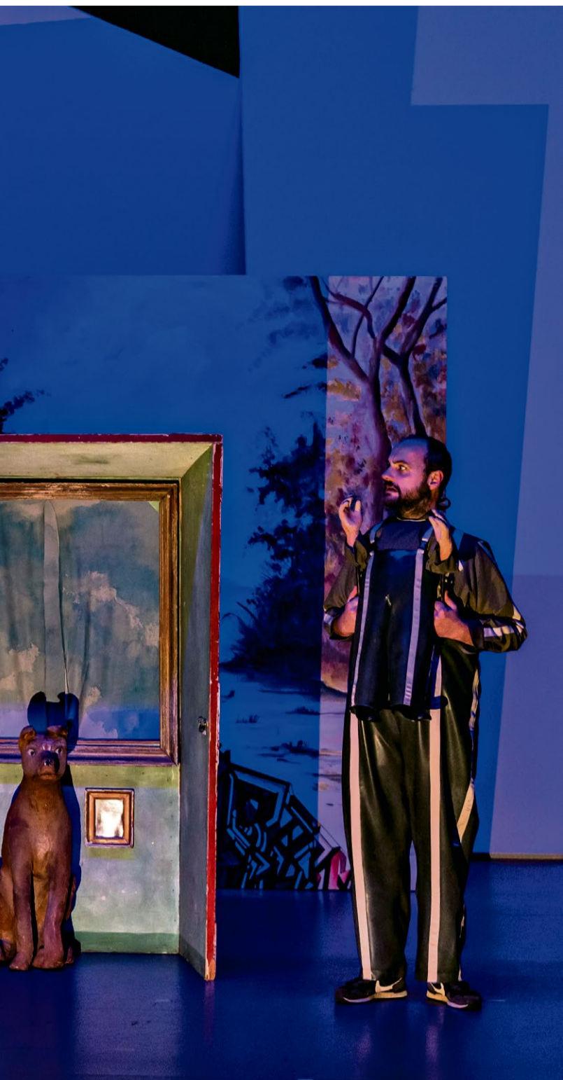
L'acteur Valère Novarina. (PARIS, 31 OCTOBRE 2023/TUONG-VI NGUYEN)

sa matière, avec des chansons à l'accordéon à pleurer. En apothéose, la merveilleuse Claire Sermonne, notre guide dans la jungle novarinienne, célèbre la parole comme principe élémentaire: elle est, pour l'auteur, la vie même par-delà l'humain.