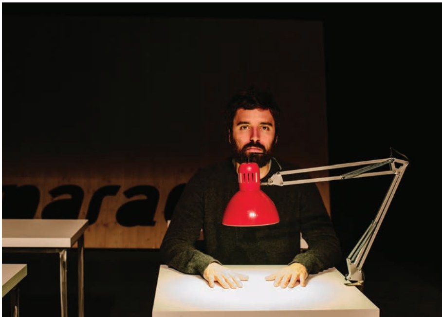
Répétition de Home Made